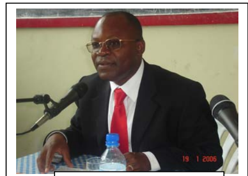
M. Christian Hemedi

27. Ainsi, le viol est une infraction autonome, mais celui commis en temps de guerre est un crime de guerre ou crime contre l'humanité, il en est de même pour d'autres infractions.