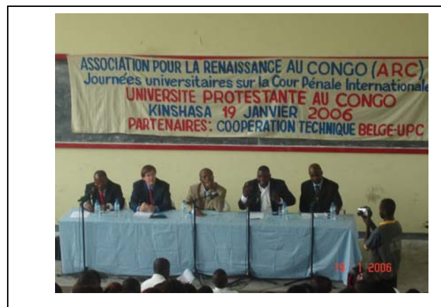
Une vue générale des orateurs

82. Esquissant de prime abord un bref historique, l'orateur a fixé au 19 e siècle, précisément en 1872, la genèse d'une