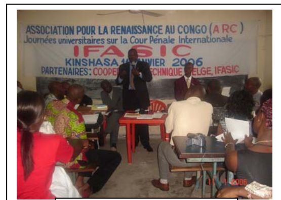
Un auditoire attentif