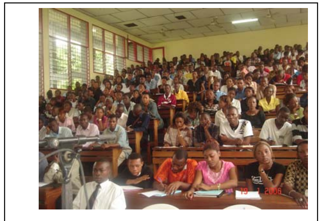
Vue des participants à l'UPC

48. Abordant le premier point relatif à la composition, l'orateur a expliqué le fonctionnement des quatre organes principaux de la CPI et leurs animateurs.